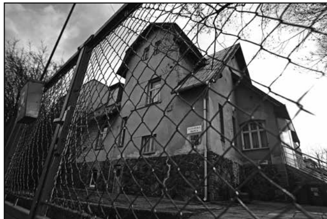
Budoucnost MŠ Matjuchinova je nejistá.

Zastupitelé jsou přesvědčeni o nutnosti problém urychleně řešit, a proto byl na konci února vytvořen výbor pro řešení kritického kapacitního stavu MŠ a ZŠ a dostal ihned zadání připravit a předložit zastupitelstvu do 30. dubna návrhy řešení, a to včetně rozpočtových úprav. Výbor se již několikrát sešel a pozval si k řešení i odborníky urbanisty a architektky a na poslední jednání ředitele ZŠ. Zápisy z jednání jsou k dispozici na webových stránkách MČ. Pokud omezím článek jen na MŠ, pak výbor doporučil mimo jiného zabývat se možností výstavby v bloku D Slunečního města, a to formou vyhlášení soutěže o návrh.